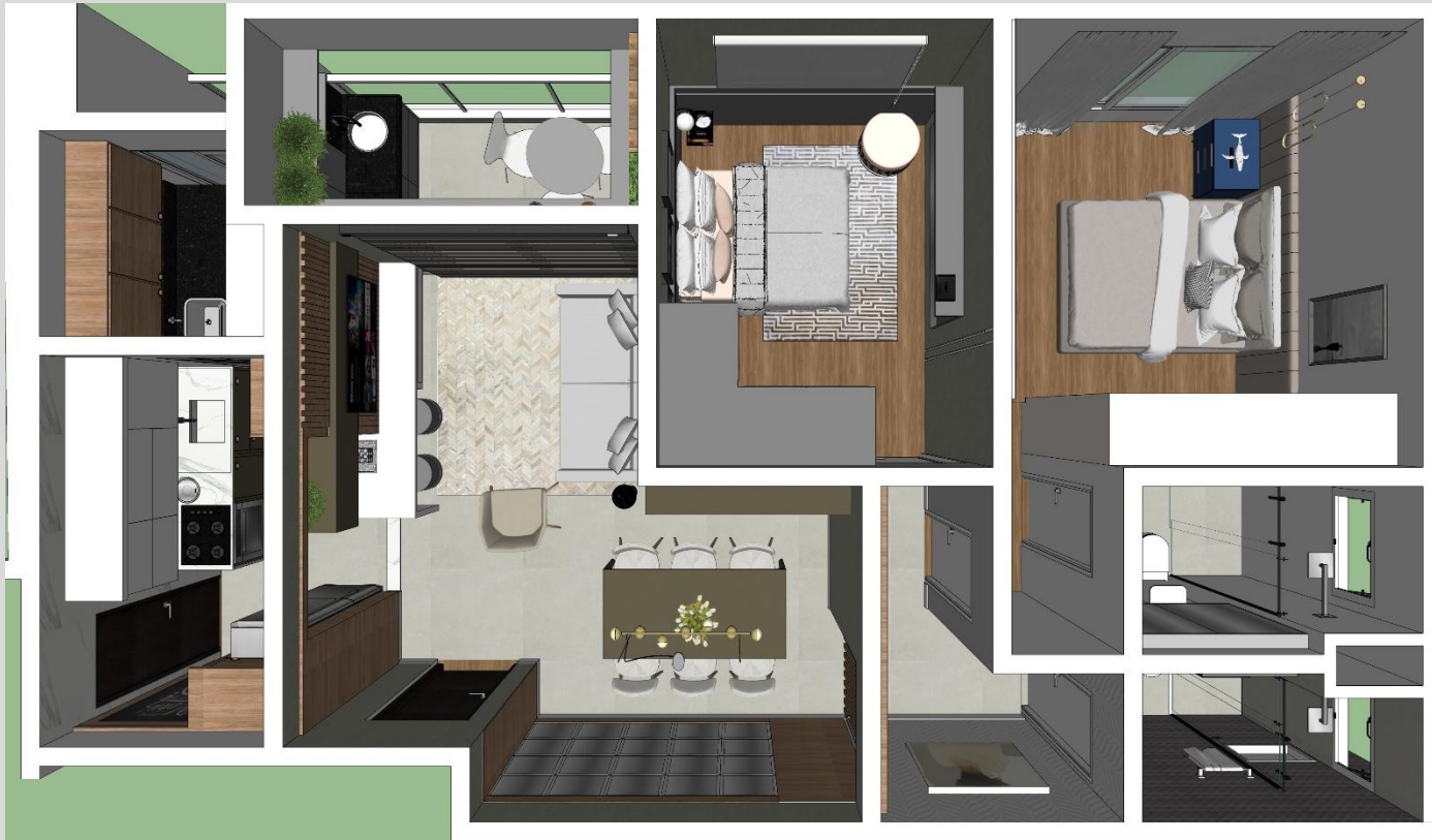
PERSPECTIVA - OPÇÃO 01