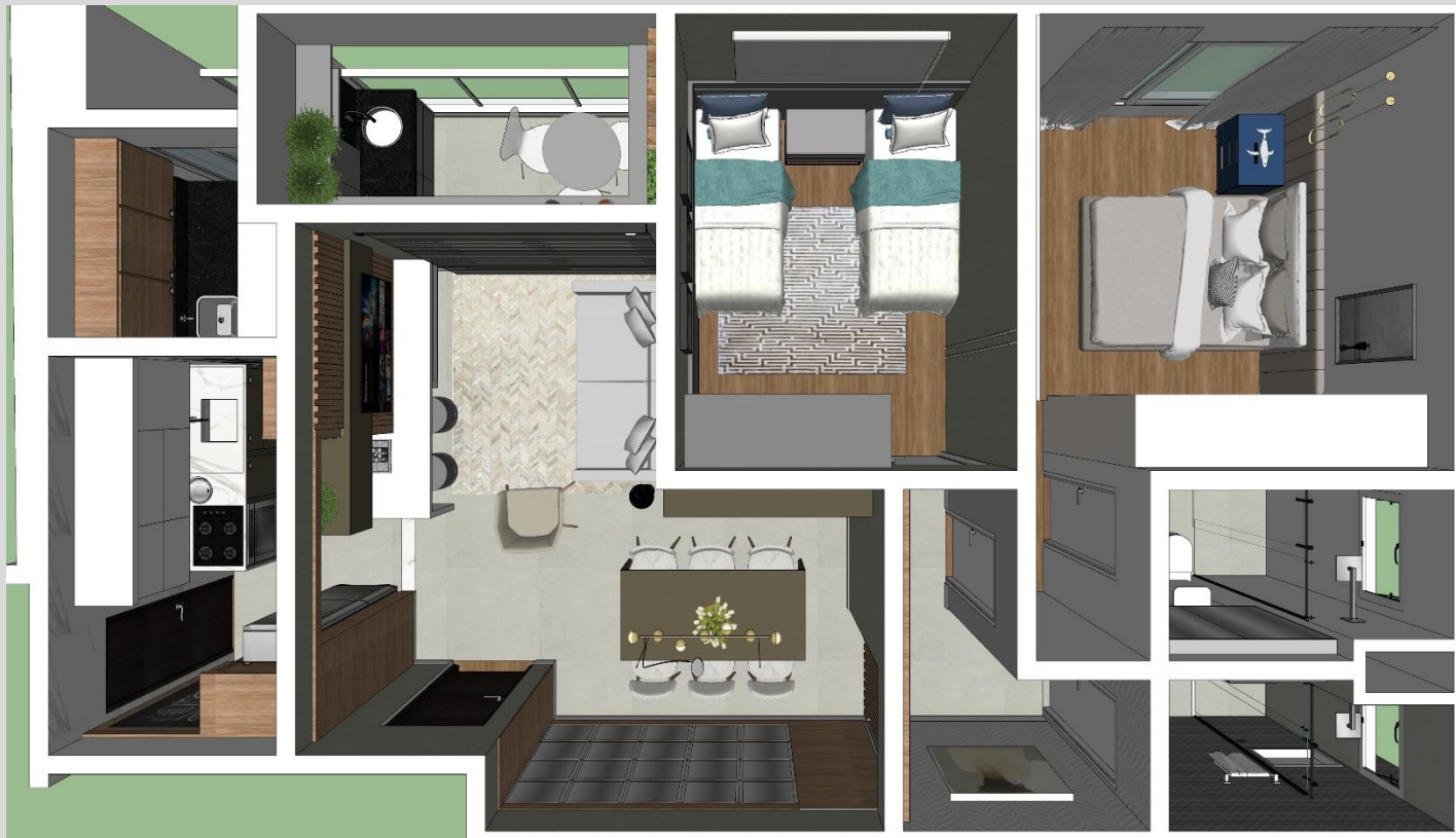
PERSPECTIVA - OPÇÃO 02